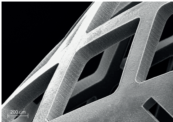
Schneidkante eines mittels Femtosekundenlaser geschnittenen, bioresorbierbaren Stents (BRS) aus PLLA, ©Coherent-ROFIN

kaum ein anderes Werkzeug ist so vielfältig, präzise und flexibel einsetzbar wie der Laser. Gerade im Bereich der Medizintechnik eröffnen diese Eigenschaften nicht nur zahlreiche neue Möglichkeiten, sie gewährleisten vielmehr, dass die mit dem Laserstrahl gefertigten oder bearbeiteten Produkte den hohen Anforderungen dieser Branche gerecht werden.