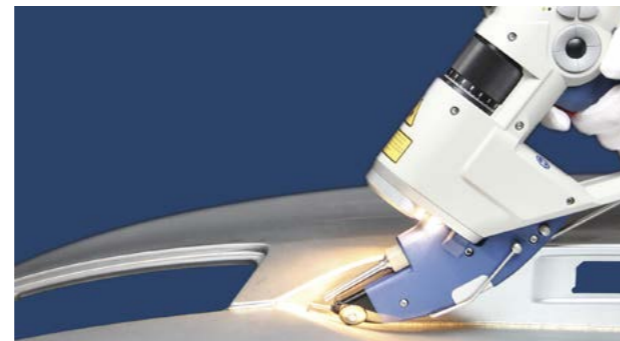
Handgeführter Laser: Der Laser kann nur betätigt werden, wenn das Handteil Kontakt zum Werkstück detektiert.

Die „Bayerischen Laserschutztage“ befassen sich mit der aktuellen Gesetzeslage und damit den Pflichten von Herstellern und Betreibern. Sie gehen auf den Stand der Lasersicherheitstechnik ein und informieren über neue Forschungsaktivitäten und Entwicklungen rund um die Lasersicherheit. Außerdem stehen die Themen persönliche Schutzausrüstung und Laser-bedingte Augenverletzungen auf der Programm der diesjährigen Tagung.