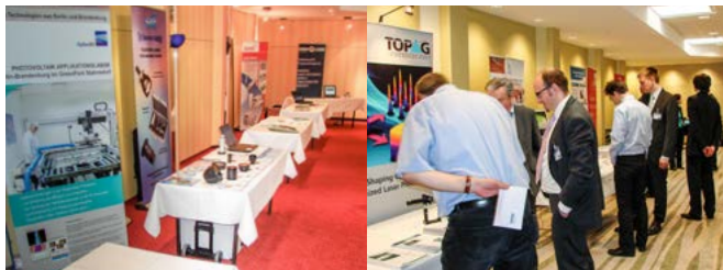
Aufnahmen früherer Table-Top-Ausstellungen

Die Veranstaltung wird von einer Table-Top-Ausstellung begleitet. Falls Sie Interesse haben, Ihr Produkt- und Dienstleistungsportfolio dort zu präsentieren, sprechen Sie uns an.